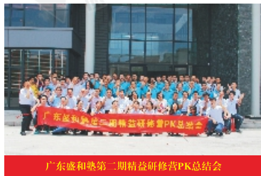
广东威和第二期精益研修营PK总结会