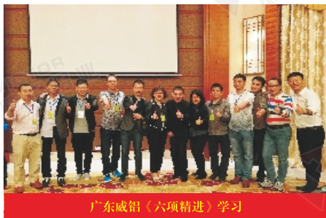
广东威铝《六项精进》学习