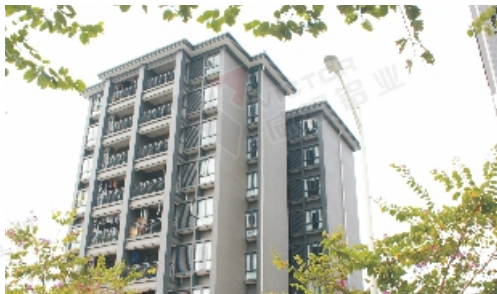
广东威铝员工宿舍