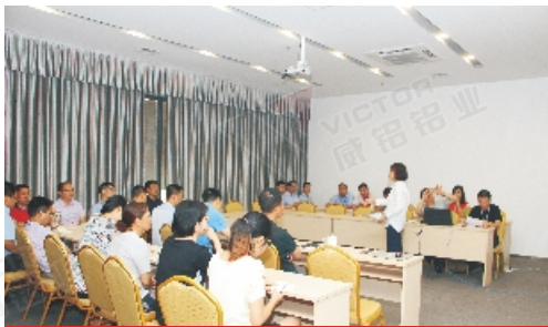
广东威铝《哲学文化手册》专题研讨会