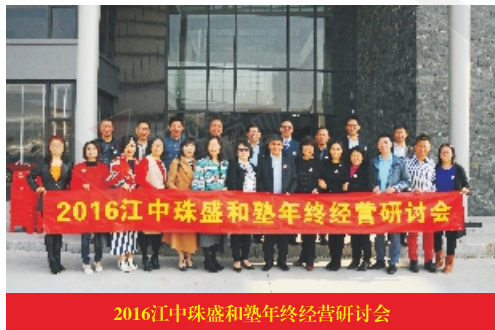
2016江中珠盛和塾年终经营研讨会