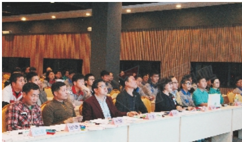
广东威铝《匠人精神15条》读书PK竞赛活动